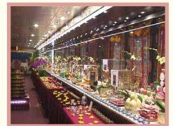
本會會址之 60 尺佛壇（側面）