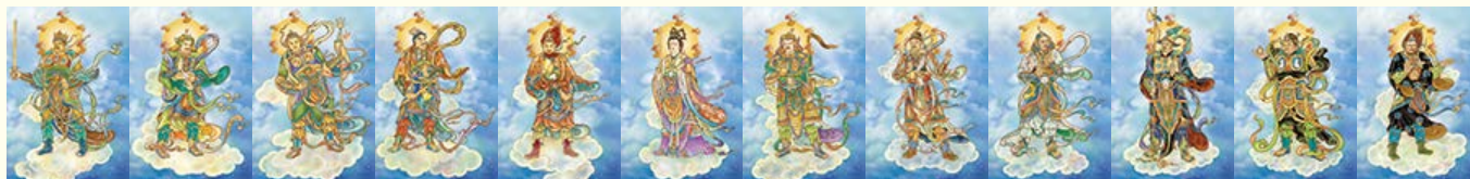
供燈予十二藥叉可「化太歲」