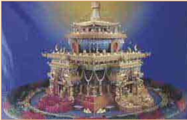
「中陰文武百尊」立體壇城

為甚麼「中陰文武百尊壇城」被視為極之殊勝呢？ 不妨從藏傳佛教之經典「密續」中了解一下。