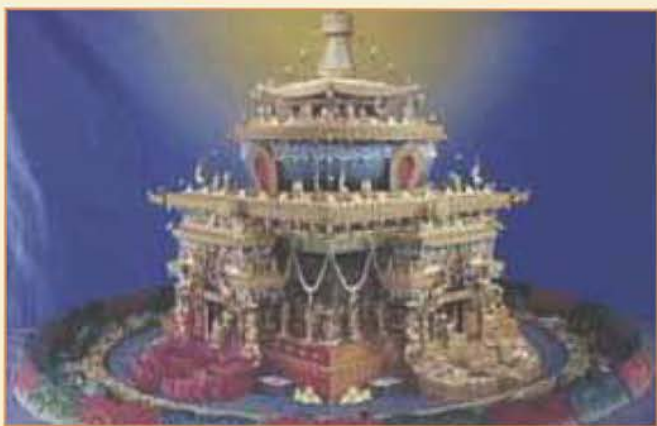
「中陰文武百尊」立體壇城

為甚麼「中陰文武百尊壇城」被視為極之殊勝呢？不妨從藏傳佛教之經典「密續」中了解一下。