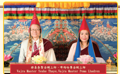
移喜泰賢金剛上師及 啤嗎哈尊金剛上師

大成就者依怙主 夏札(威操)生紀多傑法王(意即佛金剛)，是寧瑪巴(紅教)的持明聖者，為當代持有最完整之大圓滿傳承之大成就者。夏札法王曾到許多聖地及雪山中閉關苦修。如此地經過數十寒暑而得大成就，被世人尊稱為「夏札」法王(即「遁世者」或「斷行者」)，意為「所作已辦，不受後有」。五十年代末，夏札法王前往不丹及印度，並於大吉嶺附近重修一座簡單的廟宇，並成立一所專為修習「龍欽領體」法要，須要閉三年關或以上之修行人之閉關中心。此舉實為西藏人在國外建立長年閉關中心之始，並秉承佛祖及以往祖師一向之實修傳統：「生依於法、法依於窮、窮依於死、死依於岩」，從而建立了紅教獨特的純樸與踏實的修行宗風，以堅守清淨及純一的戒律與三昧耶名聞於世，長年茹素，豎立了當今人間肉身菩薩之「大智、大悲、大願、大行」的無垢典範，於此一俗世開創了一脈清泉。夏札法王於2015年12月30日涅槃，世壽105歲。