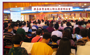
移喜泰賢金剛上師主持盂蘭法會

本會於2017年8月推出了「法會全球網上直播試驗計劃」,讓處於海外或未能出席的本港「煙供及供燈捐款者」,可以透過 YouTube 觀看部份在本會香港中心的法會內容。善信只需擁有 Gmail 戶口,並在煙供及供燈時向本會登記,即可於法會當天收到本會電郵邀請參與當日法會的現場直播。但參看直播的善信必須在法會舉行前兩天,就已經完成參加手續。參加手續很簡單,只需填寫此一表格,連同捐款收據,寄回/電郵/傳真至本會即可。海外善信可在本會網頁以「信用卡網上捐款」。請注意,本會的全球網上直播計劃只會直播部份可以公開的法會內容,其他部份的內容,例如傳法、觀想教導等,由於必須「口耳傳承」親自參與出席,所以不會在網上直播中播出,敬請留意。