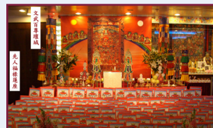
文武百尊壇城及先人牌位