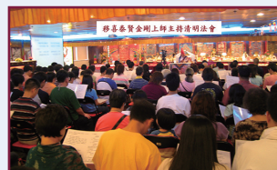
移喜泰賢金剛上師主持清明法會