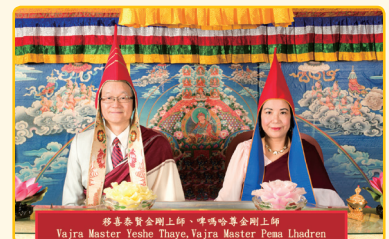
移喜泰賢金剛上師及啤瑪哈尊金剛上師

Youtube www.youtube.com/user/DudjomBuddhist