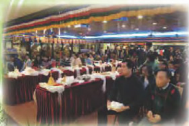
參加「 陞座典禮 」之眾弟子