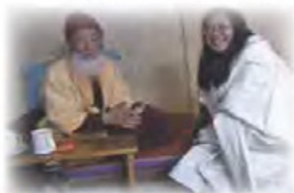
依怙主 夏札（威攝）生紀多傑法王賜法衣