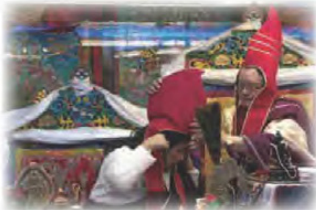
移喜泰賢金剛上師賜班智達帽子啤嗎哈尊金剛上師

金剛上師亦選擇以此曆算計法之「四聖日」舉行「陞座典禮」、供燈法會、皈依儀式，碰巧遇着核危機之時，因此藉此日之特殊能量效應、因果法則等規律，祈望能盡點綿力，為地球及眾生的生存環境而作殊勝之祈福。