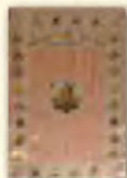
四臂觀音心咒旗幡