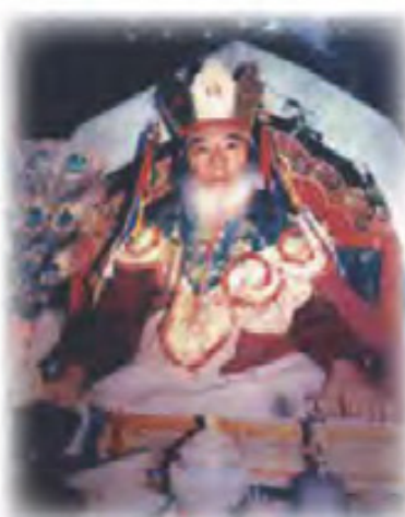
夏札（威攝）生紀多傑法王

啤嗎哈尊金剛上師跟隨漢地演密教者 舒囊卓之警青喇嘛（福德法幢 劉銳之金剛上師）學習「密法」二十多年，並得 劉上師親自授予「金剛阿闍黎」（意即「軌範師」）灌頂。同時，分別於1981及1984年親炙當時之蜜瑪巴（紅教）法王二世 依怙主 敦珠智者移喜多傑（無畏金剛智）甯波車，獲親賜法名啤嗎哈尊。啤嗎哈尊金剛上師現以當今被公認為修持最具證量及德高望重之藏密蜜瑪派（紅教）依怙主 夏札（威攝）生紀多傑法王為其「根本上師」。並得依怙主 夏札（威攝）生紀多傑法王賜「法衣」。啤嗎哈尊金剛上師亦是敦珠佛學會的創辦人及導師之一，全力弘揚佛法，以利益一切如母有情。其所演譯之佛法深入淺出，見解精闢獨到，分別以真實體驗、科學分析、人生百態、經典故事、佛陀金句、深層分析、結構推理等不同的層面，將深層的佛法，以入世之事理，注入人「心」。即使已經對佛法有一定認識的眾生，在聽聞此等演譯之後，對佛法之認識不單更深一層，而且有「豁然開竅」的感覺。最令人讚嘆之佛法實修講解為13片「顯密實修課程」，其中很多內容為前人所未能深入解釋的精闢實修細節，因而突顯了啤嗎哈尊金剛上師的高度實修水準及智慧。