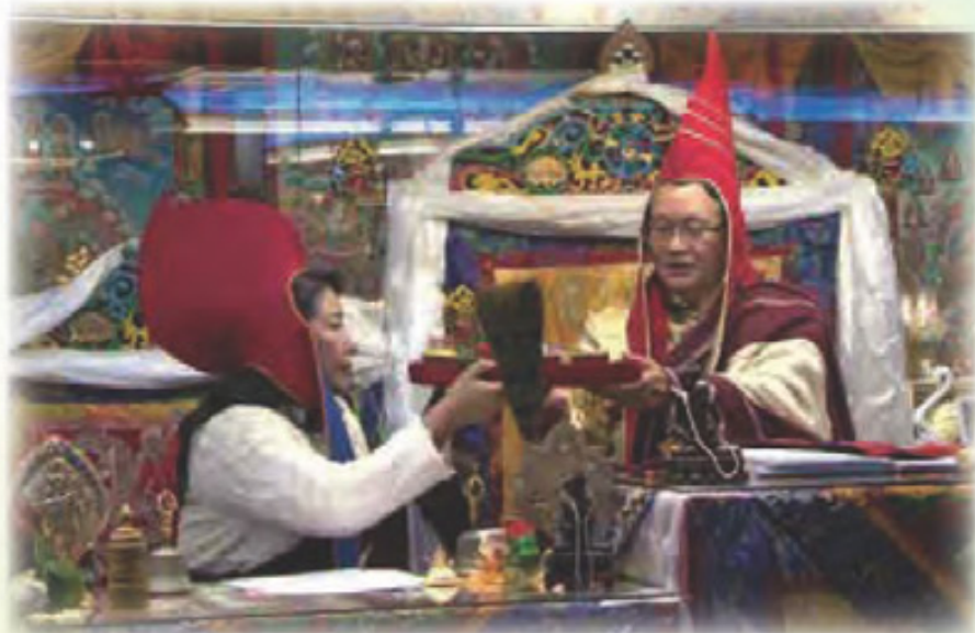
移喜泰賢金剛上師 賜八種吉祥物予 啤嗎哈尊金剛上師