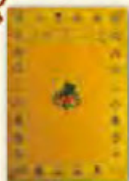
綠度母經幡 (祈求疾速圓滿)