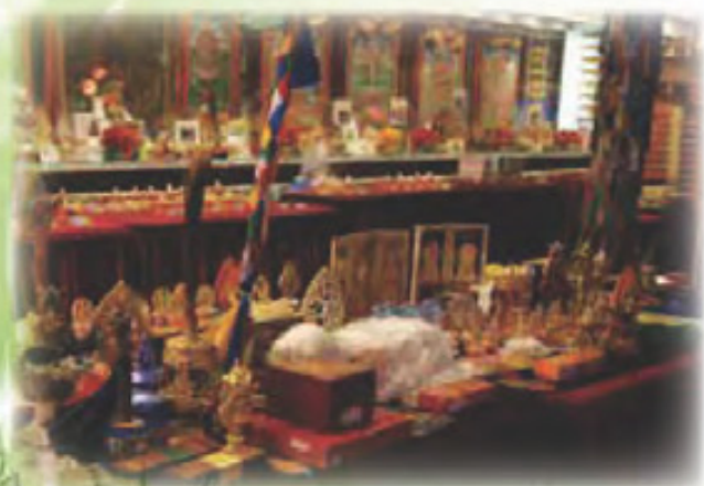
眾弟子獻予 啤嗎哈尊金剛上師 眾多不同功德之法物