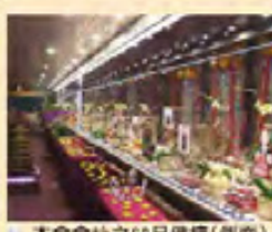
本會會址之60尺佛壇(側面)

備註：「自願日期」代表你或親友的特別日期，例如生辰、壽辰、畢業、添丁、開張、喜慶、吉日，亦可以在患病、病手痛、重大轉機之日或特別祈求增福添壽等；亦可以為先人之冥誕或過去時辰祈禱往生福樂、釋摩等。