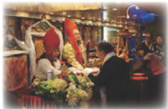
弟子向 啤嗎哈尊金剛上師 獻水晶柱