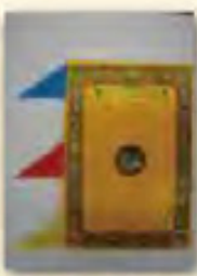
文殊(智)、觀音(仁)、 金剛手(勇)三依怙 經幡