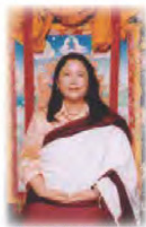
啤嗎哈尊金剛上師

5. 被授予「2009年度中國百名改革創新風雲人物」的榮譽稱號，並獲特別邀請成為「中國國際經濟發展研究中心」的「高級研究員」（此榮譽稱號由「中國國際經濟發展研究中心」在「北京人民大會堂」所舉辦的「國際經濟論壇年年會」上頒發。）