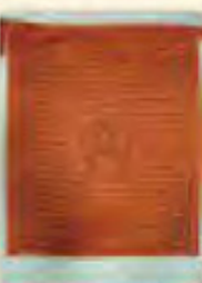
咕嚕咕咧佛母經幡 (增加人緣)