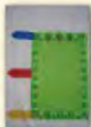
蓮師如意成就壇城 經幡(除障如願)