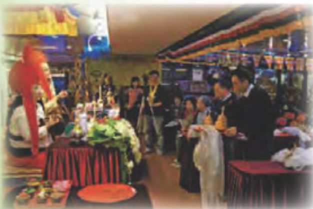
弟子向 移喜泰賢 及 啤嗎哈尊金剛上師 獻曼達祈禱上師健康長壽住世