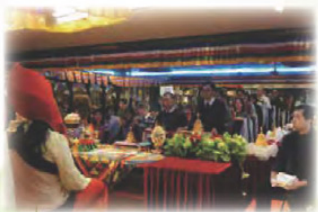
弟子眾列隊向 啤嗎哈尊金剛上師 獻上眾多不同功德之法物