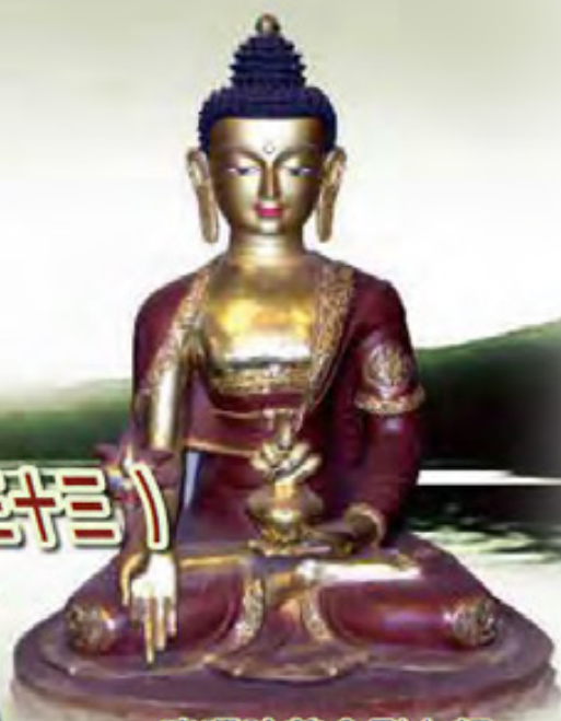
啤嗎哈尊金剛上師