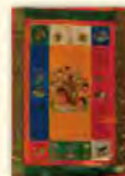
格薩爾王護法經幡 (護持世出世法)