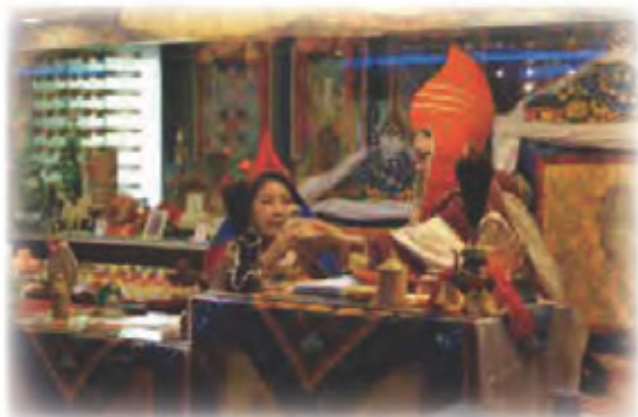
移喜泰賢金剛上師賜水晶柱予 啤嗎哈尊金剛上師