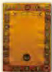
蓮師心咒旗幡 (一切祈求如願)