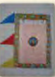
金剛薩 經幡 (消除業障)