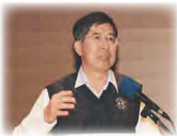
台灣成功大學醫學院外科教授李伯璋教授

曾經經歷過重病的人，會發現：疾病與悲傷，每一個人所受到的影響都各不相同，與親友的關係也會因這些經歷而改變。究竟由陪伴者、親友、及專業輔導員主導的「分析與採用」，還有甚麼要注意及分析的地方呢？可以「採用」甚麼策略呢？台灣成功大學醫學院外科教授李伯璋教授，以醫生的身份，對現今的醫療界及必定會面對死亡的每一位人士與親屬，作出以下的建議：