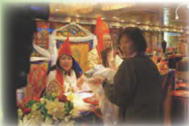
弟子向 啤嗎哈尊金剛上師 獻鉞刀、大法螺