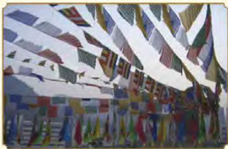
懸掛於本會會址 內之經幡

「經幡」的藏文名稱為「風馬」（藏音「隆他」Lungta），是「密乘」用以「除障、開顯智慧、祈福、迴向功德」的一種善巧法門，可以對治業緣上的障礙。