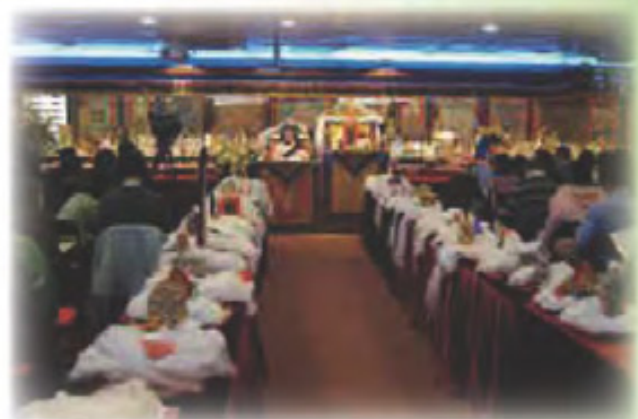
「 陞座典禮 」及眾獻供物