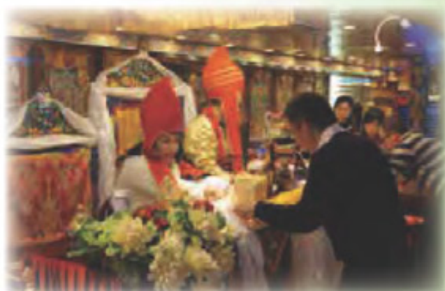
弟子向 啤嗎哈尊金剛上師 獻佛之身、語、意