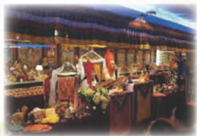
移喜泰賢 及 啤嗎哈尊金剛上師 迴向一切功德予一切受苦受難的眾生及祈願熄滅核災難