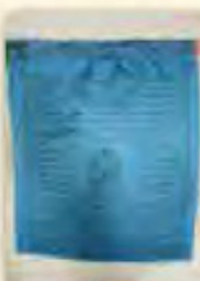
藥師佛經幡 (消災延壽)