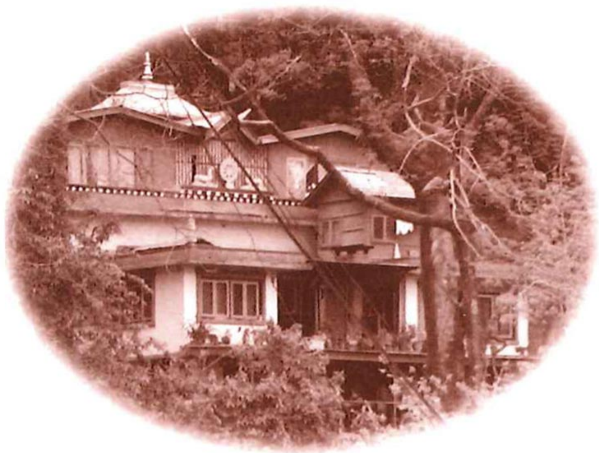
圖 3.86 依怙主 威操甯波車位於尼泊爾巴萍「羊尼雪」之廟宇。

༄༅། །མཚོ་གཤིས་མཚན་མས་ཀྱིས་རྒྱལ་ཚེ་བུ། །དབང་བསྐྱུར་ལུང་བྱིན་ཕྱོགས་མེད་་་། །གཞན་དོན་སྤོང། །སྤྱོད་པ་འོན་པ་འགྱོར་ཀུན་སྤངས་ཚེ་གསུམ་ཆེན་པ། །མངས་རྒྱས་རྗེ་རྗེ་འོན་པས་ །ལ་གསུམ་ལ་བའདབས། །