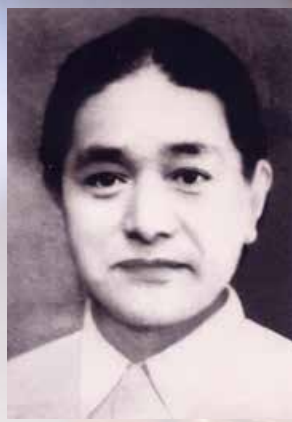
敦珠法王年輕時攝(1)