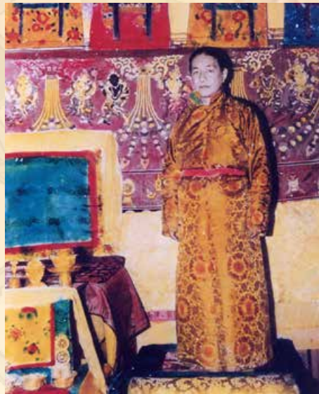
敦珠法王於西藏之桑耶寺內攝

一代宗師之敦珠法王，一如釋尊，縱已「成就」，亦以利益眾生而示現生死如幻、諸行無常，於一九八七年一月十七日，在法國南部之博都閉關中心，入「大般涅槃」。其「法體」因修持「大圓滿」而縮小，成就「虹光身」之一種（請參看由敦珠佛學會出版的「藏傳佛教甯瑪派之虹光身」光碟）。法王法體奉安於尼泊爾大白塔附近之敦珠祖廟。安奉法王法體之「舍利塔」與寺廟之翻新工程，全部皆由依怙主 夏札(威操)生紀多傑甯波車策劃及完成。