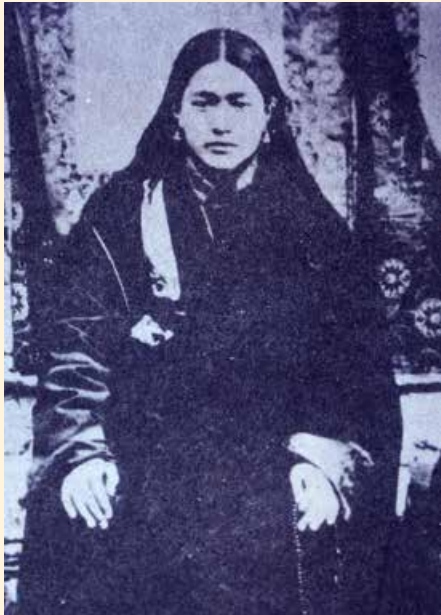
敦珠法王年輕時攝(2)

而被眾人認定為 敦珠甯巴之真實轉世，毫無異議。其降生早於 蓮師八世紀入西藏時已有授記，述及其此世將降生為 敦珠法王，內含日期、地點、及各種詳細徵兆。